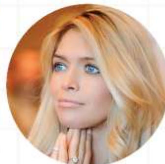
Вера Брежнева, певица, Посол доброй воли ЮНЭЙДС

«Нужно знать все о ВИЧ и о том, как защитить себя. Это ваше здоровье и ваша жизнь. Убеждать кого-то в необходимости сохранить здоровье можно только собственным примером»