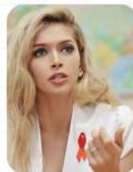
Вера Брежнева, певица, Посол доброй воли ЮНЭЙДС

«Мне бы очень хотелось, чтобы в обществе исчезли табу на обсуждение проблемы ВИЧ-инфекции. Если вы узнаете, что кто-то из ваших знакомых живёт с ВИЧ, не отворачивайтесь от него, а поддержите и помогите. Это может произойти с каждым»